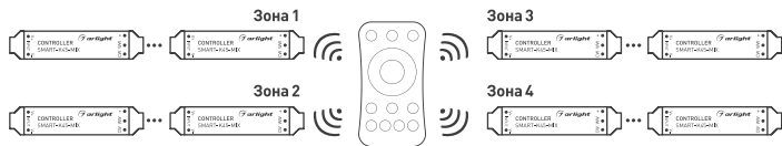
Рисунок 3. Вариант построения системы с 4-зонным пультом дистанционного управления